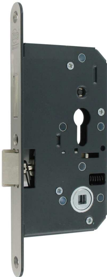
A86 D5 Cilinderslot