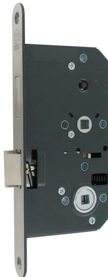
A85 D5 Toiletslot