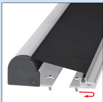
Vue latérale, vis invisibles