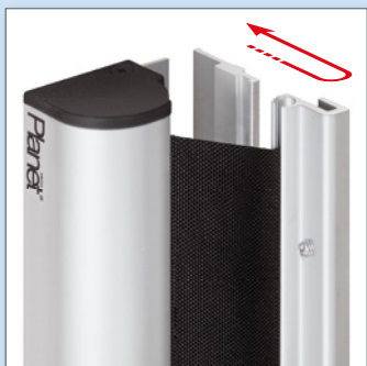
Système d'accrochage & décrochage